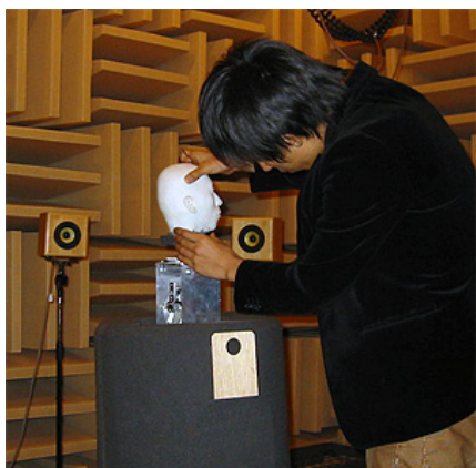
Fig.1: Mounting a 70%-scaled dummy head on the TeleHead I in an anechoic room.

ダミーヘッドは、MRI (Shimadzu-Marconi, MAGNEX ECLIPSE 1.5T Power Drive 250) で計測した 3 次元の実頭形状データから光造形